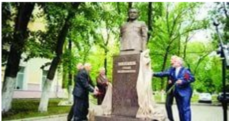
Памятник Миронову И.И. – первостроитель города Новокуйбышевска

Мальчик: Одна из главных улиц в городе Новокуйбышевске – это улица Миронова. Заканчивается эта улица площадью Ленина. В центре площади в честь нашего бывшего вождя поставлен памятник В.И.Ленину. Памятник был установлен в 1959 году. Скульпторами памятника были Белстоцкий и Фридман, а архитекторами Слободяник и Шмах. Высота памятника 7,5 метров.